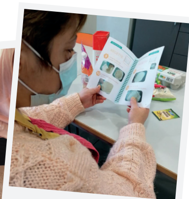
Culture et loisirs

PLATEFORME COLLABORATIVE DE RESSOURCES destinée à améliorer la qualité de l'accompagnement des personnes en situation de handicap.