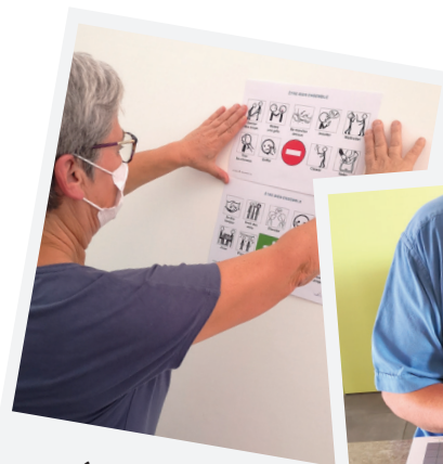
Aide à la communication