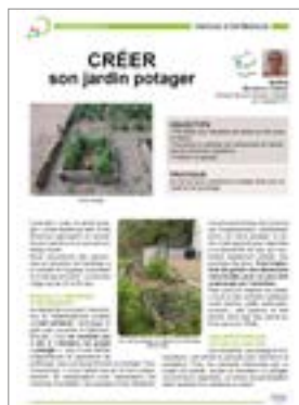
Cliquer sur > Créer son jardin potager

Un échange efficace pour renouveler ses idées ou une méthode pour mettre en place un nouveau projet avec les personnes accompagnées.