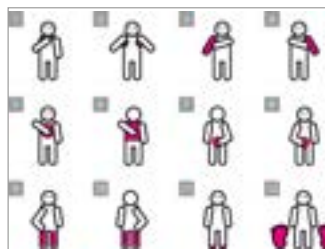
Cliquer sur > Outils - Frise aide à la douche Fiche éducateur