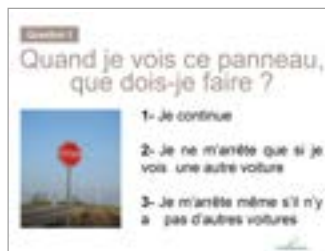
Cliquer sur > Diaporama jeu code de la route

Des outils téléchargeables sur la plateforme (cahier d'échanges, règles de vie en pictos, tableau de présence éducative...) facilitent le quotidien et la communication des personnes accompagnées, et le travail des encadrants. Un gain de temps indéniable pour les aidants, une variété appréciée par les usagers.