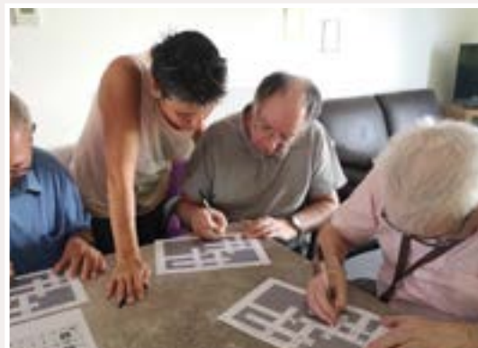
Déjà plusieurs centaines de contenus en ligne