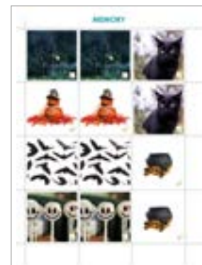
Cliquer sur > Jeu mémoire - domino- thème Halloween